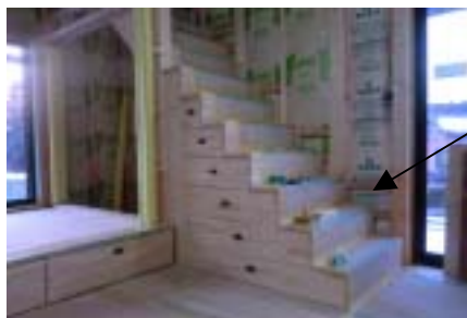
階段の収納です。現代風階段箆筒です