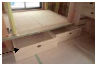
小上がりの和室です。大き目の引き出しでたっぷり収納ができます。

お施主さまのご好意により完成見学会をさせていただくことになりました。外観は「蔵」のようなシンプルで落ち着いた感じの家です。床は無垢のフローラーを使っていて木の温かみを感じていただけ玄関の天井、和室の天井もお施主さまと相談し変わった仕上がりになっています。2階にはロフトも・・・見て感じていただけるところがたくさんある家になると思いますので是非、お時間がありましたらご来場いただきたいと思います。3月頃に予定していますので詳しいことは来月のニュースレターでお知らせさせていただきます。