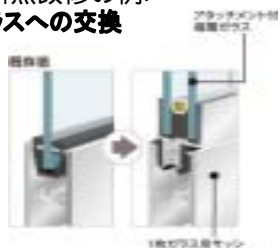
複層ガラスへの交換